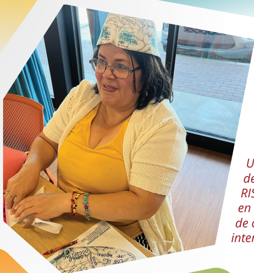
Una proveedora de Educadores RISE participa en una actividad de capacitación interactiva.